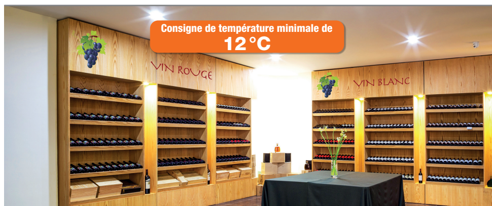
CLIMATISATION DÉDIÉE AUX CAVES À VIN OU À TOUT LOCAL BASSE TEMPÉRATURE

→ Échangeurs surdimensionnés (pas de prise en glace)